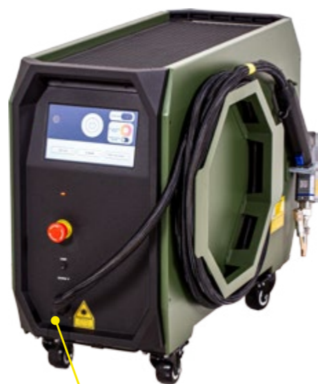
HS LASER 45