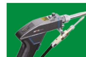
Tocha de solda com alimentação de arame.

O painel traseiro possui marcações claras, possibilitando uma rápida instalação do equipamento. Requer apenas uma fonte AC 220 V monofásica para alimentação do sistema, um suprimento de gás (argônio ou nitrogênio) e a conexão do cabo terra na peça de trabalho.