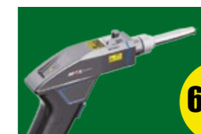
Tocha de solda sem alimentação.