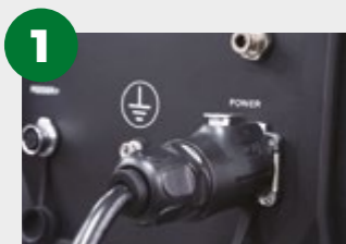
1 - Alimentação 220 V monofásica;