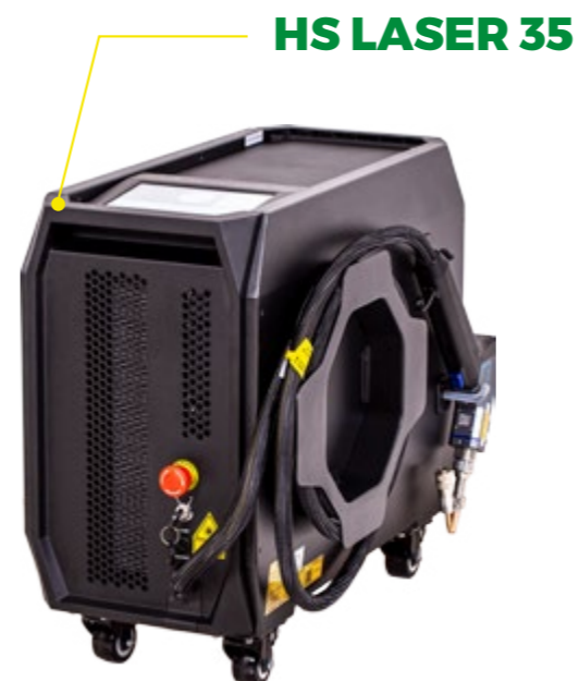
HS LASER 35