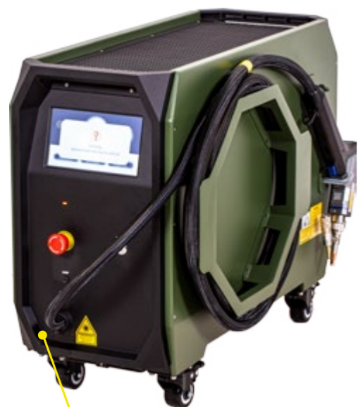
HS LASER 65